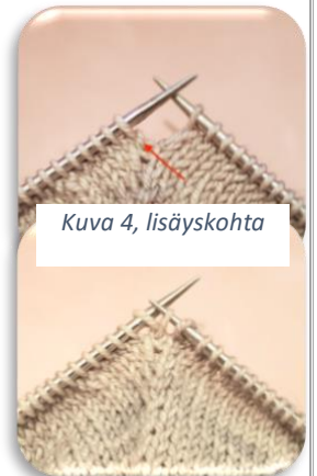
Kuva 4, lisäyskohta

Laske silmukoiden määrä ja jaa se 8:lla (8 kavennuskohtaa). Neulo seur. kerros kuten olet tähän astikin neulonut ja aseta samalla silmukkamerkit jakotuloksen silmukkamäärän mukaisesti osoittamaan kavennuskohtat, mielellään