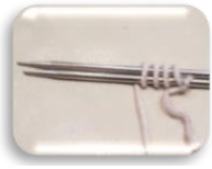
Kuva 1, kieputetut alkusilmukat